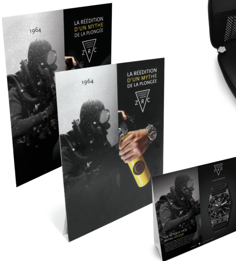
Fond de vitrine Chevalet de comptoir Cubes duo faces - lot de 2 Window sticker Counter card Dual face cubes - 2 pcs