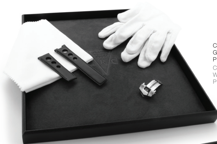
Chiffonnette Gants d'horloger Plateau présentoir Cloth Watchmaker glove Presentation tray