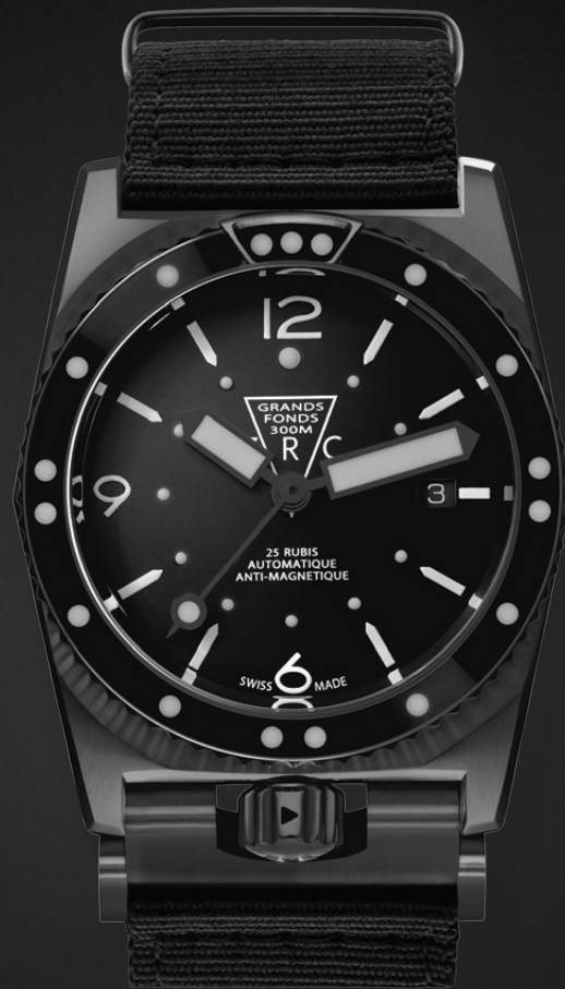
"Black Phantom" - model - Full DLC

GF300 distributors in Paris: Romain Réa, 6 Rue du Bac | Louis Pion la Madeleine, 9 Place de la Madeleine