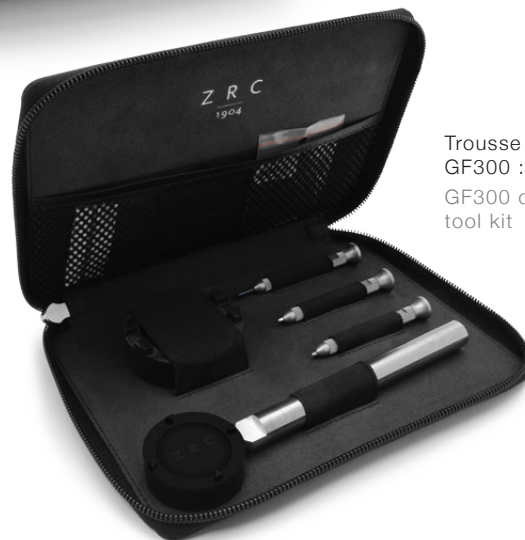
Trousse outillage GF300 : Concessionnaire GF300 official dealer tool kit