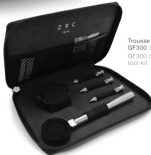
Trousse outillage GF300 : Concessionnaire GF300 official dealer tool kit