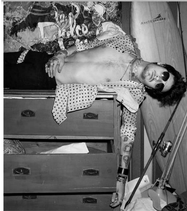
Glasses-Acutis Necklace- Tant D'Avenir Bracelets-Uno de 50 and ZRC Shirt-Garcons Infideles Jeans- Garcons Infideles

http://www.kaltblut-magazine.com/lea-rostain-quentin-pontonnier/